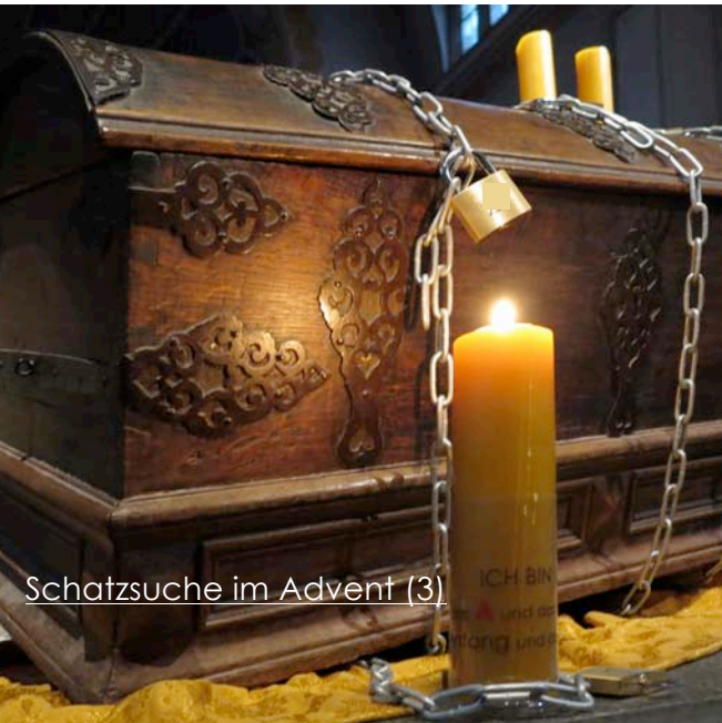
Schatzsuche im Advent (3)

„Nun tragt eurer Güte hellen Schein weit in die dunkle Welt hinein.“