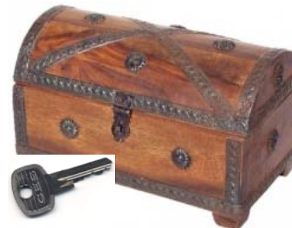
Schatzsuche im Advent (1)