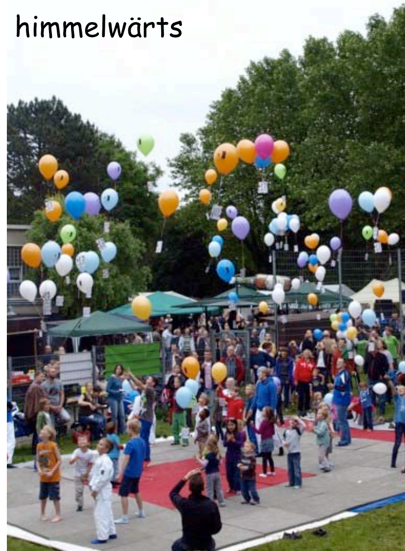
Luftballonaktion beim Gemeindefest 2013