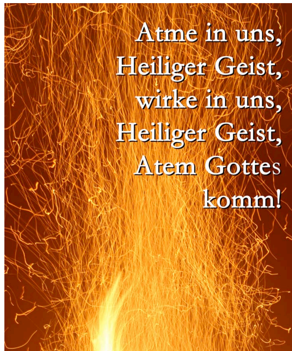
Foto und Gestaltung: Tim Wollenhaupt – Text: Lied aus dem neuen Gotteslob

Auf der neuen Homepage unserer Gemeinde ( www.hoentrop-kirche.de ) gibt es unter „Gemeindenachrichten“ jede Woche einen kurzen ‚Impuls zum Sonntag‘: Gedanken zum Sonntagsevangelium aus der Feder engagierter Gemeinemitglieder.