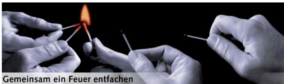
Gemeinsam ein Feuer entfachen

Sie lesen einen Roman oder sehen einen Film – ob im Kino oder im Fernsehen – und plötzlich berührt Sie eine Szene tief und nachhaltig. Über solche Erfahrungen wollen wir als Christinnen miteinander ins Gespräch kommen. Herzliche Einladung in die ANSPRECH-BAR am Mittwoch, 17. April 2013 , 19.30 Uhr im Gemeindezentrum St. Maria Magdalena (maGma), Vincenzstr. 11. Wir freuen uns auf interessierte Gesprächspartnerinnen! Initiativkreis der kfd St. Maria Magdalena